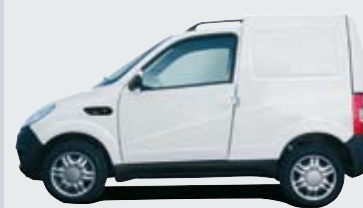
Version Design Couleur : Blanc