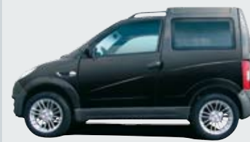
Version Sport Couleurs : Blanc - Noir